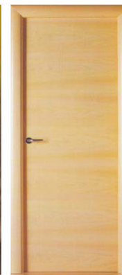
LISA HORIZONTAL HAYA VAPORIZADA