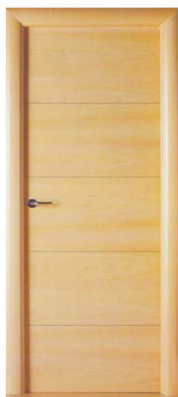
LISA HORIZONTAL INCRUSTACION ALUM. HAYA VAPORIZADA

RANURADO TIPO "PICO DE GORRION". POSIBILIDAD DE LINEAS DE GRECAS, MARQUETERIA O INCRUSTACION.