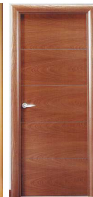
LISA HORIZONTAL INCRUSTACION ALUM CEDRO BOSSE