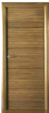
LISA HORIZONTAL 4 PGH ROBLE NAT. LISTADO